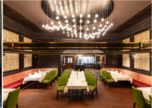
Serviette 80m 2