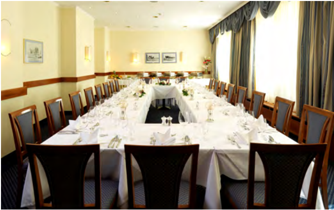
Salon 60m 2