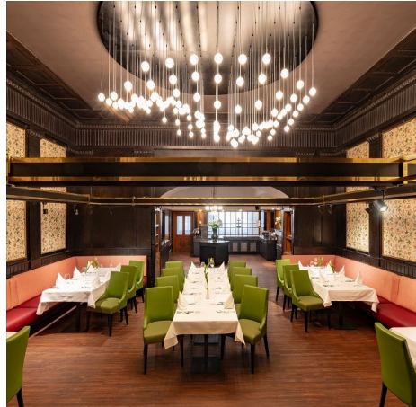
Serviette 80m 2

MAXIMALE PERSONENANZAHL BEI DEN RAUMSTELLUNGEN: