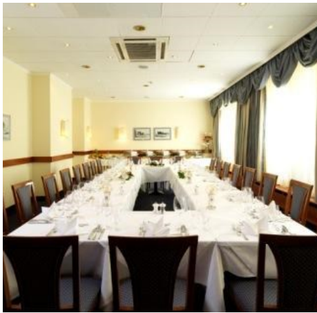
Salon 60m 2