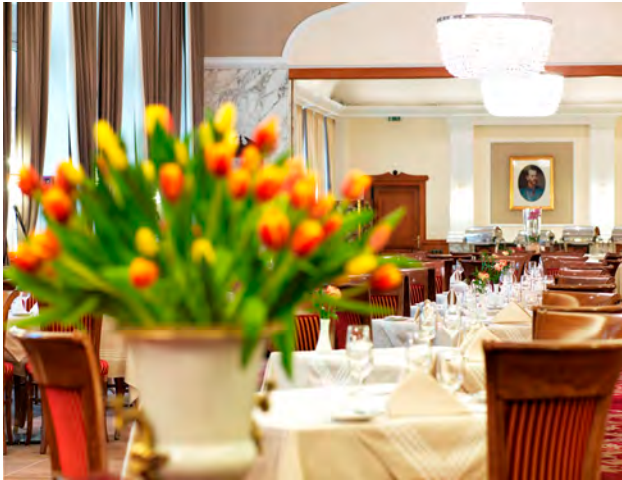
Festsaal 235 m 2 - in 3 Teile unterteilbar