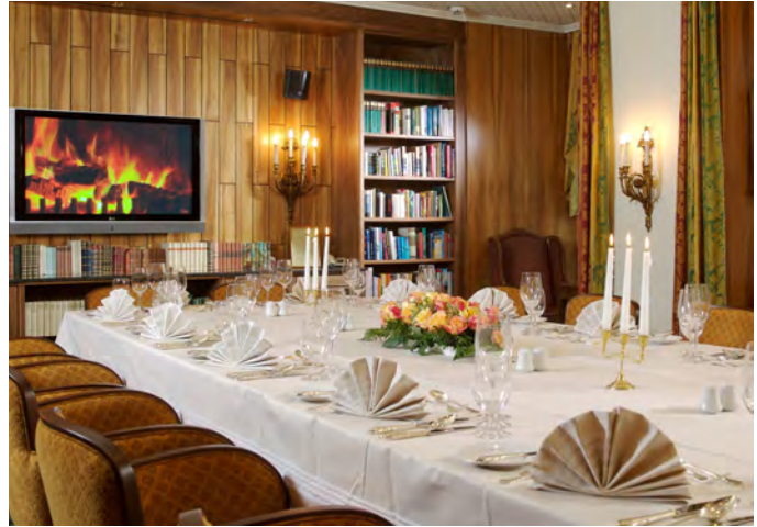
Bibliothek 45 m 2